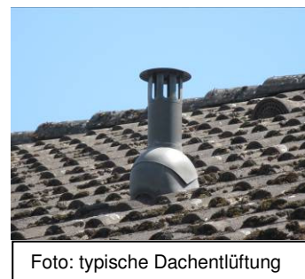
Foto: typische Dachentlüftung

Spülunfälle werden grundsätzlich durch Revisionsschächte (Abwasser-Kontrollschächte) vermieden, denn diese bieten einen Zugang für Wartungsarbeiten am Kanal und auch Raum für den Druckausgleich. Daher sind Schächte auch auf privaten Grundstücken Pflicht!