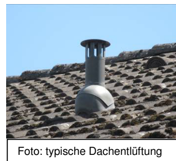
Foto: typische Dachentlüftung

Spülunfälle werden grundsätzlich durch Revisionsschächte (Abwasser-Kontrollschächte) vermieden, denn diese bieten einen Zugang für Wartungsarbeiten am Kanal und auch Raum für den Druckausgleich. Daher sind Schächte auch auf privaten Grundstücken Pflicht!